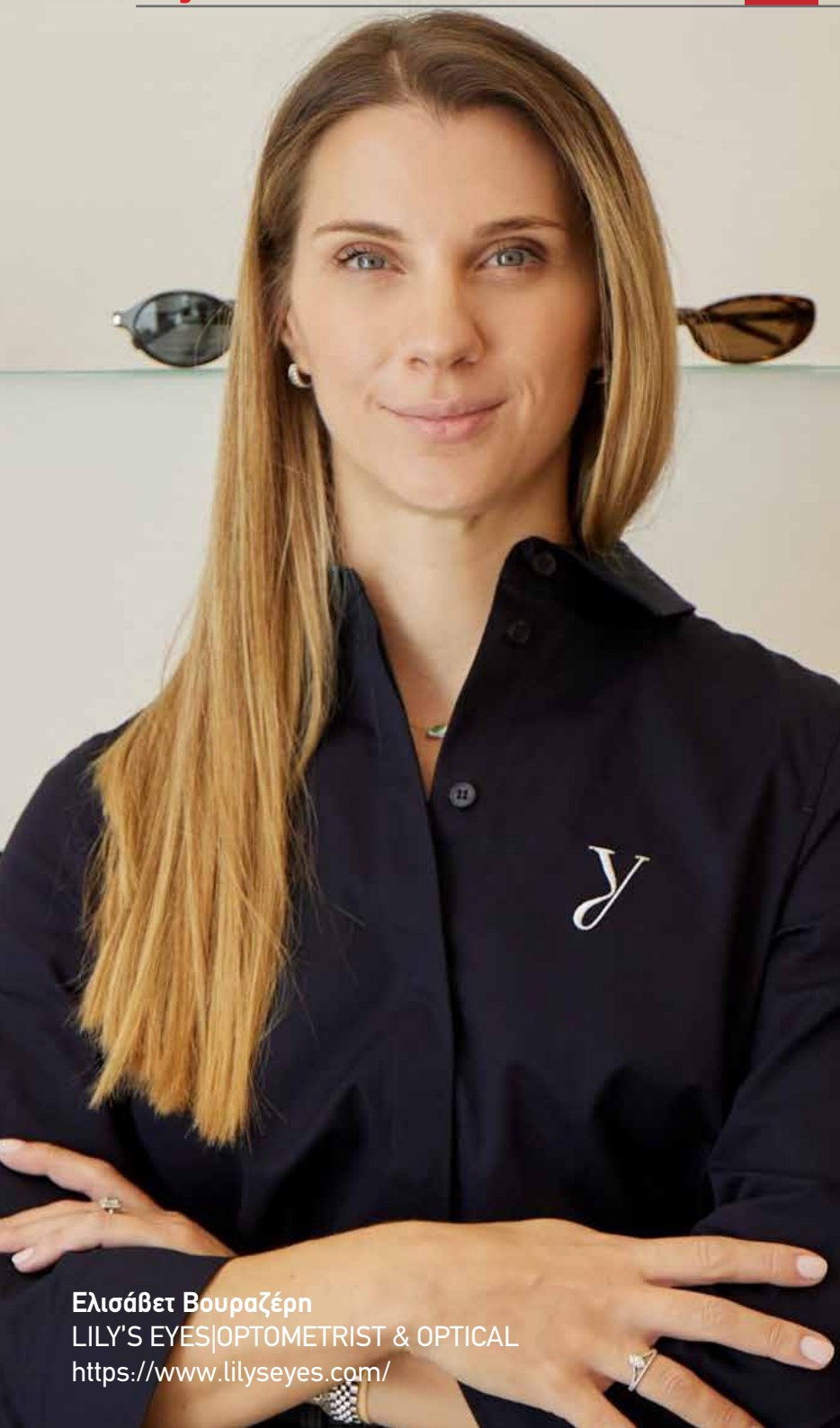
Ελισάβετ Βουραζέρη LILY'S EYES|OPTOMETRIST & OPTICAL https://www.lilyseyes.com/